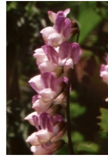
à inconnu observée le 4 juillet 1999 par Liliane Roubaudi

Réseau Tela botanica, Programme Flora Data, version dynamique.