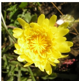
à inconnu observée le 27 juillet 2008 par Alain Bigou

Réseau Tela botanica, Programme Flora Data, version dynamique.