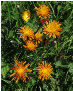
à inconnu observée le 12 juillet 2022 par Claire Felloni

Réseau Tela botanica, Programme Flora Data, version dynamique.