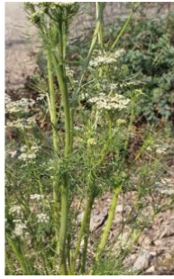
à inconnu observée le 23 mars 2015 par Liliane Roubaudi

Réseau Tela botanica, Programme Flora Data, version dynamique.