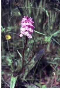
à inconnu observée le 9 juillet 1995 par Liliane Roubaudi

Réseau Tela botanica, Programme Flora Data, version dynamique.