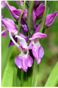
à inconnu observée le 23 mai 2011 par Michel Cantagrel

Réseau Tela botanica, Programme Flora Data, version dynamique.