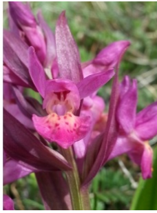
à inconnu observée le 3 mai 2015 par Henri Scordia

Réseau Tela botanica, Programme Flora Data, version dynamique.