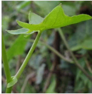
à inconnu observée le 3 février 2012 par Marie Portas

Réseau Tela botanica, Programme Flora Data, version dynamique.