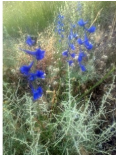
à inconnu observée le 24 mai 2017 par Ismael Gomez

Réseau Tela botanica, Programme Flora Data, version dynamique.