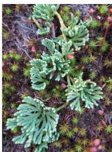
à inconnu observée le 7 septembre 2013 par Hugues Tinguy

Réseau Tela botanica, Programme Flora Data, version dynamique.