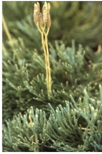
à inconnu observée le 3 octobre 1992 par Liliane Roubaudi

Réseau Tela botanica, Programme Flora Data, version dynamique.