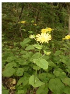
à inconnu observée le 6 juin 2015 par Christine Jourdan

Réseau Tela botanica, Programme Flora Data, version dynamique.