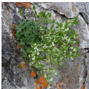
à inconnu observée le 25 juin 2018 par Alain Bigou

Réseau Tela botanica, Programme Flora Data, version dynamique.