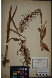
à inconnu observée le 1 juillet 1874 par Herbier Pontarlier-marichal

Réseau Tela botanica, Programme Flora Data, version dynamique.