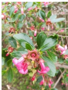
à inconnu observée le 16 mai 2018 par Thomas Roche

Réseau Tela botanica, Programme Flora Data, version dynamique.