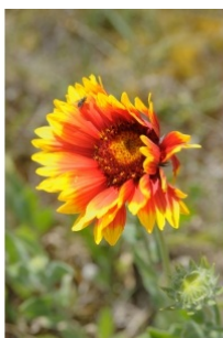
à inconnu observée le 9 juin 2009 par Jean-Pierre Cazes

Réseau Tela botanica, Programme Flora Data, version dynamique.