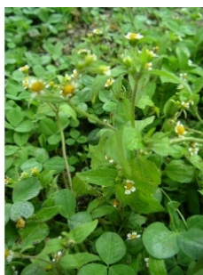
à inconnu observée le 25 septembre 2005 par Sylvain Piry

Réseau Tela botanica, Programme Flora Data, version dynamique.