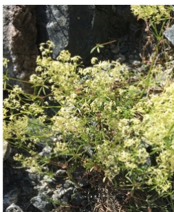
à inconnu observée le 8 août 2019 par François Fares Mansour

Réseau Tela botanica, Programme Flora Data, version dynamique.