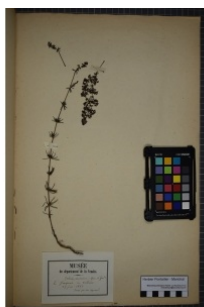
à inconnu observée le 27 juin 1852 par Herbier Pontarlier-marichal

Réseau Tela botanica, Programme Flora Data, version dynamique.