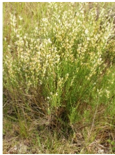
à inconnu observée le 25 mai 2006 par Alain Bigou

Réseau Tela botanica, Programme Flora Data, version dynamique.