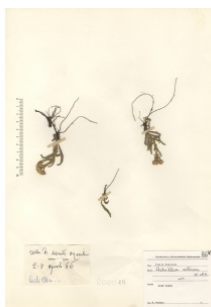
à inconnu observée le 23 août 1966 par La Spada Arturo

Réseau Tela botanica, Programme Flora Data, version dynamique.