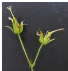
à inconnu observée le 28 juin 2012 par bertrand.bui@...

Réseau Tela botanica, Programme Flora Data, version dynamique.