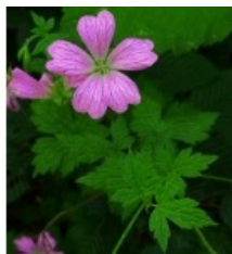
à inconnu observée le 28 juin 2012 par bertrand.bui@...

Réseau Tela botanica, Programme Flora Data, version dynamique.