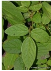
à inconnu observée le inconnue par Thierry Pernot

Réseau Tela botanica, Programme Flora Data, version dynamique.