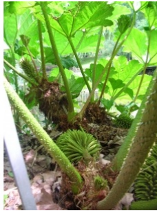
à inconnu observée le 27 juin 2007 par Yvan Martin

Réseau Tela botanica, Programme Flora Data, version dynamique.