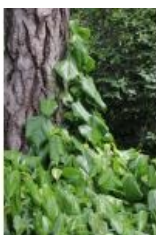
à inconnu observée le 12 juin 2013 par Marie Portas

Réseau Tela botanica, Programme Flora Data, version dynamique.