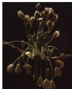
à inconnu observée le 6 février 2003 par Liliane Roubaudi

Réseau Tela botanica, Programme Flora Data, version dynamique.