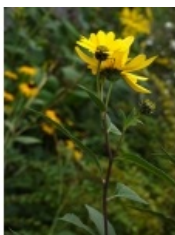
à inconnu observée le 3 octobre 2012 par Liliane Roubaudi

Réseau Tela botanica, Programme Flora Data, version dynamique.