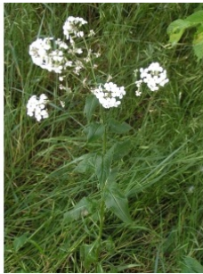
à inconnu observée le 11 mai 2005 par Alain Bigou

Réseau Tela botanica, Programme Flora Data, version dynamique.