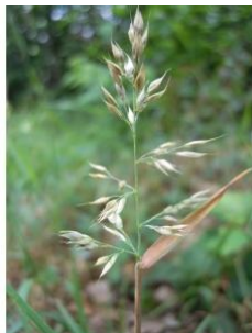
à inconnu observée le 20 juin 2011 par David Mercier

Réseau Tela botanica, Programme Flora Data, version dynamique.