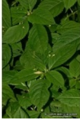
à inconnu observée le inconnue par Thierry Pernot

Réseau Tela botanica, Programme Flora Data, version dynamique.