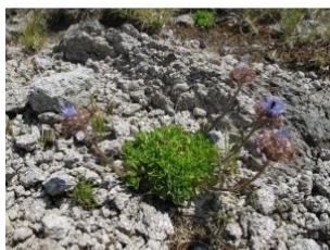
à inconnu observée le 5 août 2013 par Hugues Tinguy

Réseau Tela botanica, Programme Flora Data, version dynamique.