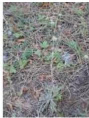
à inconnu observée le 19 juillet 2012 par Franck Jullin

Réseau Tela botanica, Programme Flora Data, version dynamique.