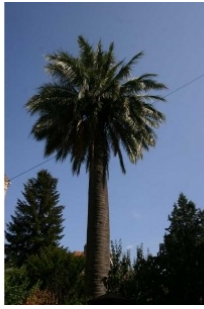
à inconnu observée le 27 août 2009 par jean françois Casale

Réseau Tela botanica, Programme Flora Data, version dynamique.