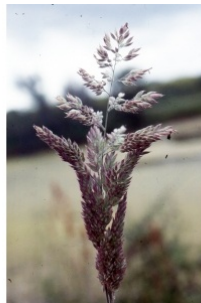
à inconnu observée le 17 mai 2003 par Liliane Roubaudi

Réseau Tela botanica, Programme Flora Data, version dynamique.