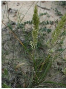
à inconnu observée le 13 juin 2010 par Jérôme Segonds

Réseau Tela botanica, Programme Flora Data, version dynamique.