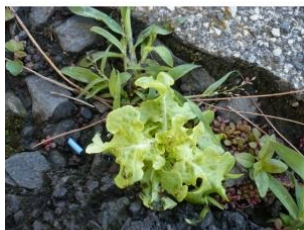
à inconnu observée le 30 mai 2018 par Christine Jourdan

Réseau Ĥ la botanica, Programme Flora Data, version dynamique.