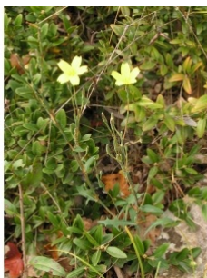
à inconnu observée le 15 octobre 2005 par Alain Bigou

Réseau Tela botanica, Programme Flora Data, version dynamique.