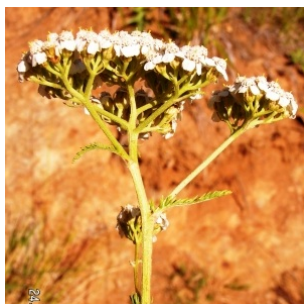
à inconnu observée le 24 août 2008 par Alain Bigou

Réseau Tela botanica, Programme Flora Data, version dynamique.