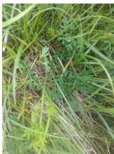
à inconnu observée le 15 juin 2016 par Florent Beck

Réseau Tela botanica, Programme Flora Data, version dynamique.