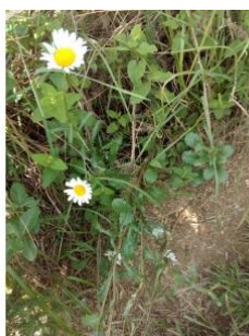
à inconnu observée le 29 mai 2016 par Florent Beck

Réseau Tela botanica, Programme Flora Data, version dynamique.