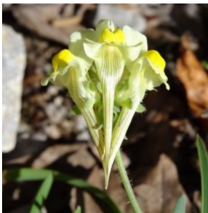
à inconnu observée le 26 septembre 2013 par Alain Bigou

Réseau Tela botanica, Programme Flora Data, version dynamique.