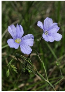
à inconnu observée le 1 mai 2012 par Gérard CalbÉrac

Réseau Tela botanica, Programme Flora Data, version dynamique.