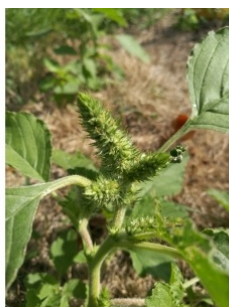
à inconnu observée le 7 août 2017 par ROMAIN Pvr

Réseau Tela botanica, Programme Flora Data, version dynamique.