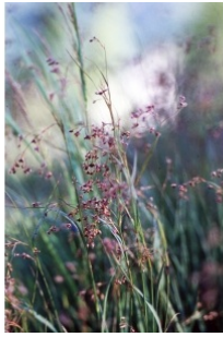
à inconnu observée le 20 juin 2000 par Liliane Roubaudi

Réseau Tela botanica, Programme Flora Data, version dynamique.