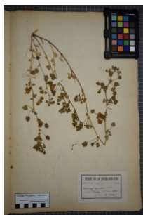
à inconnu observée le 26 mai 1887 par Herbier Pontarlier-marichal

Réseau Tela botanica, Programme Flora Data, version dynamique.