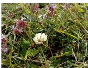
à inconnu observée le 15 juin 2016 par Florent Beck

Réseau Tela botanica, Programme Flora Data, version dynamique.