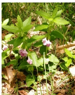
à inconnu observée le 11 mai 2005 par Alain Bigou

Réseau Tela botanica, Programme Flora Data, version dynamique.