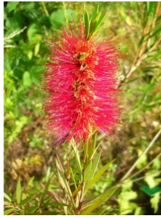
à inconnu observée le 27 juin 2007 par Yoan Martin

Réseau Tela botanica, Programme Flora Data, version dynamique.