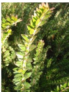
à inconnu observée le 11 décembre 2016 par Genevieve Botti

Réseau Tela botanica, Programme Flora Data, version dynamique.