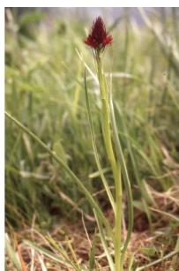
à inconnu observée le 2 juillet 1994 par Liliane Roubaudi

Réseau Tela botanica, Programme Flora Data, version dynamique.